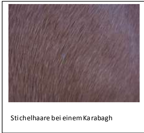
Stichelhaare bei einem Karabagh

Über Abzeichen gibt das Stutbuch Nr. 1 Auskunft: „Die unterscheidende Besonderheit der Karabagh rasse sind die weißen Abzeichen an Kopf und Beinen.“ Spätestens für den Fall, dass das Zuchtziel des Goldfuchsfalbens erreicht würde, wären Abzeichen in der Tat hilfreich, um die sich gleichenden Pferde unterscheiden zu können. Vielleicht ist der Satz aber auch so zu verstehen, dass es den Karabaghen ähnelnde Pferde gibt (oder gab), die