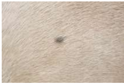
„Wüstenfleck“ beim Karabagh

ausweiten können. Zudem sind in Deutschland photosensibilisierend wirkende Doldengewächse wie Wilde Möhre, Wiesenkerbel und Wiesenbärenklau, deren Genuss unpigmentierter Haut leichter zum Sonnenbrand verhilft, weitaus verbreiteter als in Aserbaidschan. Anfällige Pferde sind Reitern lästig und lassen sich nicht gut vermarkten. Weil es somit nicht nur in Deutschland vernünftige Gründe gegen eine Anhäufung von weißen Abzeichen im Karabagh gibt, kann eine sparsamere Ausprägung nicht schaden.