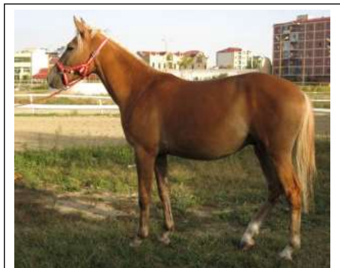
Hellfuchsfalbe mit Flachs- und Schmutzgen

2013 fiel der IG ein sehr untypisch wirkender Hellfuchsfalbe unter den Karabaghen auf. Er war allem Anschein nach Träger des Schmutzgens und des Flachsgens. Das Schmutzgen ist bisher nicht