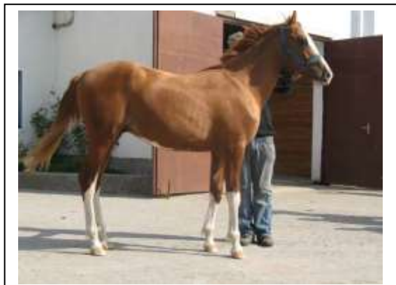
Hochweiß gestiefelter Karabagh mit Bauchfleck – Übergang zur Scheckung?