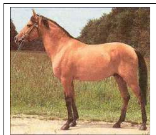
Zaman, Beispiel für „altes Blut“.

Die charakteristische Färbung der ursprünglichen Karabaghen wird im Stutbuch Nr. 1 „Naryndji“ genannt. Erklärt wird dies gemäß vorliegender Stutbuchübersetzung mit „nahe der Zitrone oder gelb-schwarz/ brauner Farbe mit Glanz am Fellhaarende. Die Mähne und der Schweif sind kastanienbraun-dunkel mit Schimmer am Fellhaarende“ Hutten-Czapki kennt als charakteristische Haarfärbung karabaghischer Kehlane (d.h. altes Blut) den Ausdruck „Naryndz“ und merkt an, dass es dafür in keiner anderen Sprache eine Benennung gibt. Er erklärt die Färbung ganz ähnlich, sodass man glauben mag, seine Beschreibung sei in das Stutbuch Nr. 1 eingeflossen: „Dieselbe nähert sich am meisten denjenigen, die wir Isabellen nennen. Es ist das ein zitronenfarbig = dunkles Gelb mit sehr deutlichem Funkenglanz an den Spitzen der einzelnen Haare; Mähne und Schweif sind kastanienbraun mit blutroter Schattierung an den Enden.“