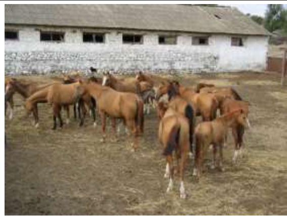
Karabaghherde in Sheki 2007

Diese Übersicht über Farb- und Fellmerkmale soll als Hilfestellung zur Bewertung von Karabagh Pferden für den Zuchteinsatz verstanden werden. Die Zusammenstellung basiert auf Angaben des ins Deutsche übersetzte Stutbuches Nr. 1 von 1981 (Exemplar freundlicher Weise von Verena Scholian zur Verfügung gestellt) und des Stutbuches Nr. 2 von 2006. Außerdem flossen Merkmale nach der Musterung aserbaidischer Zuchtpferde originalen und modernen Typs als auch deutscher Zuchtpferde mit hohem Karabaghanteil ein. Da in