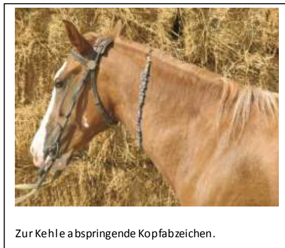
Zur Kehle abspringende Kopfabzeichen.

Bedenklich ist die Abzeichenhäufung bei Füchsen anzusehen, die bei den Karabaghen auch auf die Fuchsfalben zutrifft. Offenbar bremst das Nichtfoxallel (ein Gen, das alle Nichtfüchse haben) die Abzeichen hervorbringende Melanozytenwanderung aus. Ohne diese Bremse können weiße Abzeichen über die sonst als Trennbereiche fungierenden Sprung- und Karpalgelenke auslaufen und in abgesprengten